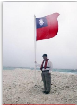
A handout picture received from Taiwan's National Security Council on Sept. 1, 2012, shows Interior Minister Lee Hong-yuan holding a national flag at Itu Aba or Taiping , the biggest islet of the disputed Spratlys on Aug.31, 2012.